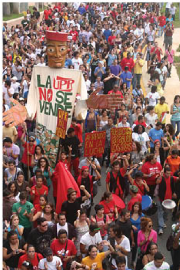
PAPEL MACHETE (Puerto Rico) El estudiante militante, 2010 Papier-mâché, cloth, acrylic, 168" x 216"